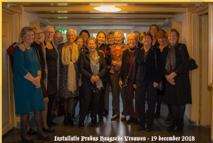
Installatie Probus Haagse Vrouwen - 19 december 2018